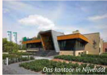
Ons kantoor in Nijverdal